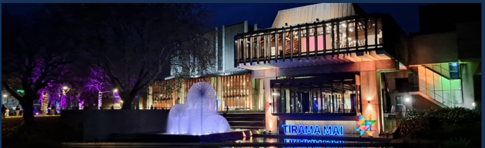
시내 중심지 - 13분 거리