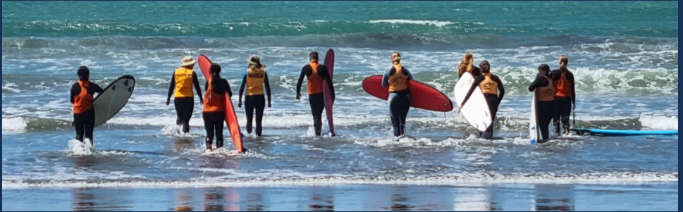
해변 - 20분 거리