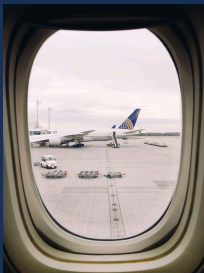
공항 - 11분 거리