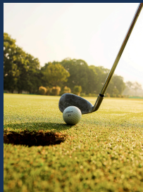
골프장 - 15분 거리