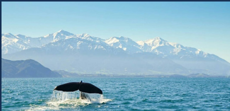
고래 관광 - 140분 거리