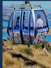
곤돌라 - 35분 거리