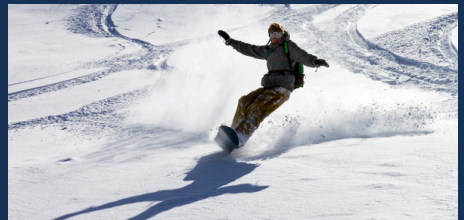
스키장 - 80분 거리