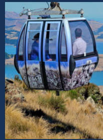
距离空中缆车35分钟